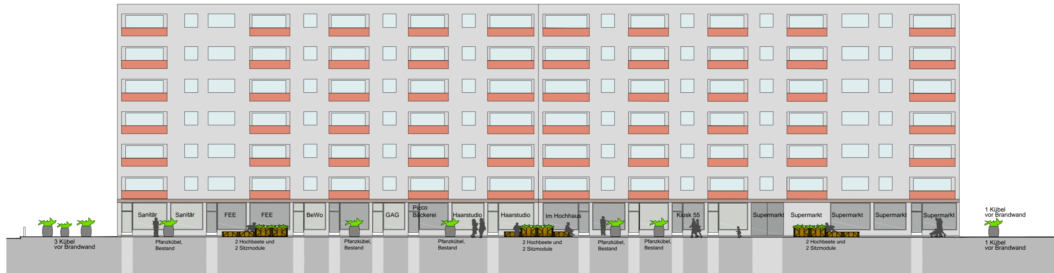
ANSICHT M 1:200